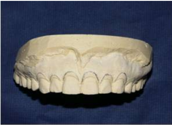
Figura 2. Demarcación de la encía a eliminar.