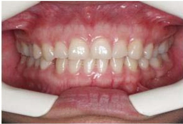
Figura 5. Preoperatorio.

permitirá ajustar el diseño de la nueva sonrisa y tener una mejor seguridad del trabajo realizado, dándole ubicación individualizada a cada punto cenit y a cada margen gingival. Figura 4.