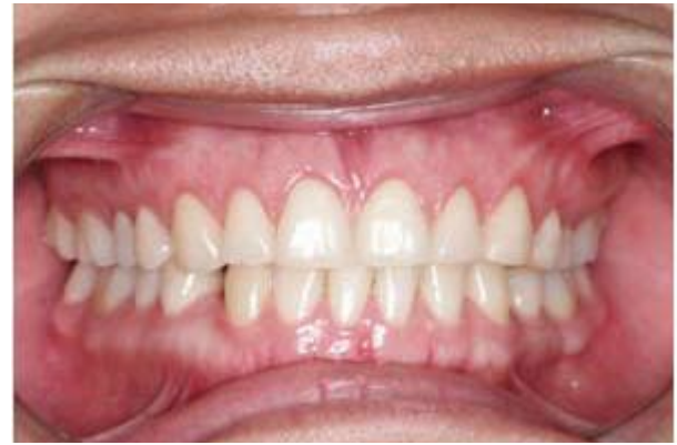
Figura 6. Postoperatorio.

Los parámetros estéticos son cruciales para un diagnóstico correcto y un adecuado plan de tratamiento.