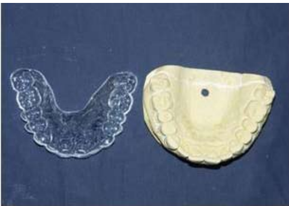
Figura 3. Elaboración de la plantilla en modelo de yeso de la paciente.

Se toman fotos intraorales con cámara Nikon D70S, lente macro 100 Nikon autofocus y flash Nikon sb 29. Luego se procesan las imágenes en photoshop, se usa la cuadrícula y se hacen los cálculos para los centrales superiores, buscando un relación ancho sobre largo de 0,8. Si ya tenemos centrales de 8,5mm de ancho, este valor se divide entre 0.8 lo cual nos dará el largo de