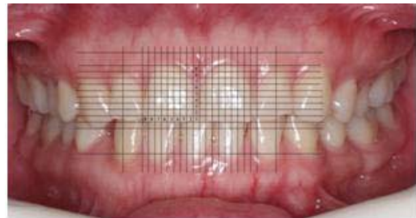
Figura 1.1. Análisis en computador