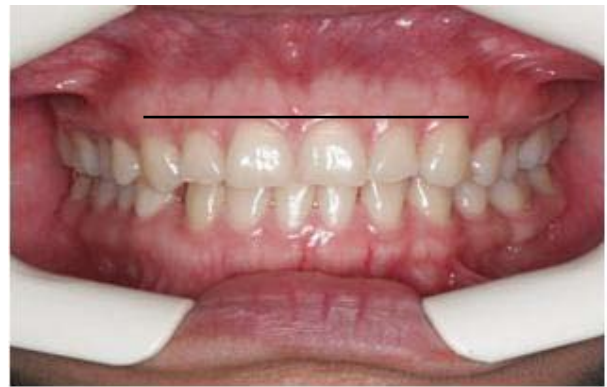
Figura 1. Situación en la cual llega la paciente.

En la figura 1 se observa la situación oral con la cual llega la paciente. En la que se observa sonrisa gingival la cual no corresponde a una sonrisa estética, armónica o aceptable desde la mirada de los parámetros expuestos.