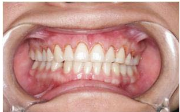
Figura 4. Imagen de la encía luego del recorte inicial con la plantilla.

La plantilla se retira de la boca de la paciente y se proceden a realizar unos nuevos recortes de la encía en diferentes sitios como son a nivel intrasurcular, a nivel interproximal y marginal sin la plantilla, lo que