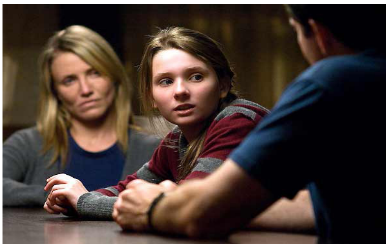
Figura 4: Sara (Cameron Diaz), Anna (Abigail Breslin) e Brian (Jason Patric).