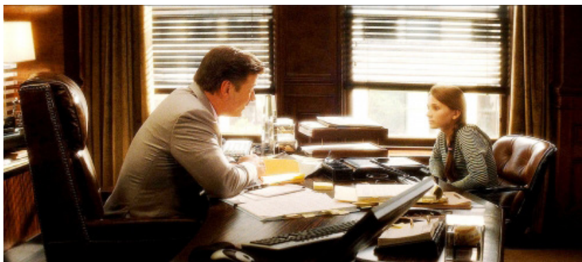
Figura 3: Campbell Alexander (Alec Baldwin) e Anna (Abigail Breslin).