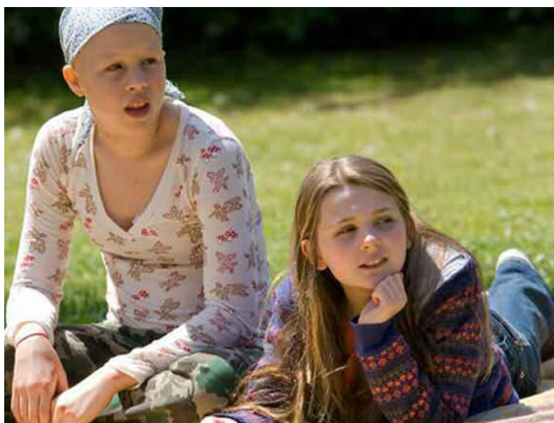
Figura 1: Kate (Sofia Vassilieva) e Anna (Abigail Breslin), personagens do filme.

Fonte: Disponível em: < http://www.cineprise.com.br/wp-content/uploads/2010/03/uma-prova-de-amor_foto1.jpg > Acesso em: 05 de março 2017.