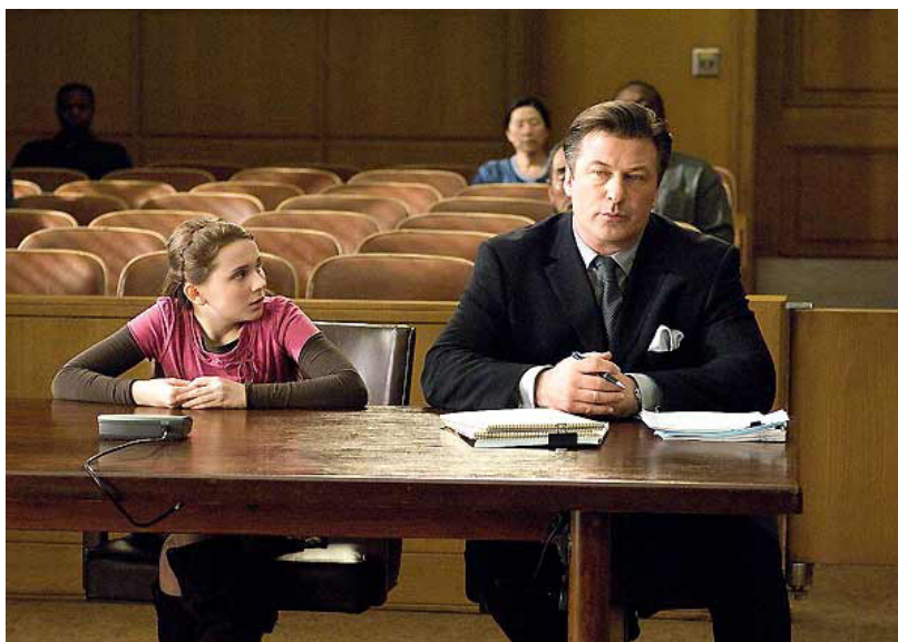
Figura 5: Campbell Alexander (Alec Baldwin) e Anna (Abigail Breslin).