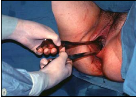
Figura 2 Desplazamiento del feto por el canal vaginal