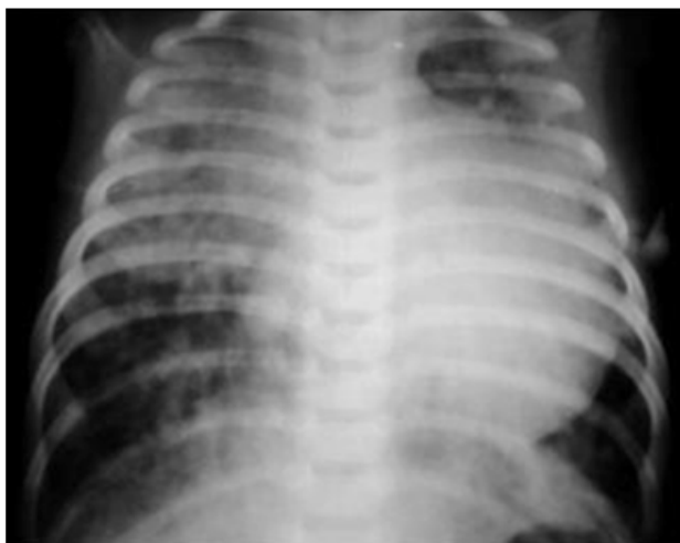
Figura 1. Radiografía de tórax. Se observa cardiomegalia con crecimiento de área cardíaca a expensas de ventrículo izquierdo, presencia de flujo pulmonar aumentado e infiltrado broncopulmonar bilateral.

Realiza primer paro cardiorespiratorio a las 11h40 por lo que se procede a entubación endotraqueal, se logra saturación de oxígeno 95 %, luce séptica, piel marmorea, hiporeactiva, campos pulmonares crepitantes abundantes; hepatomegalia 3cm por debajo del reborde costal derecho. Radiografía de tórax (figura 1) revela cardiomegalia, imágenes de hiperflujo, infiltrado parahiliar difuso, presenta evolución tórpida, hay sangrado abundante por tubo endotraqueal y sonda nasogástrica, realiza parada cardiorespiratoria por 3 ocasiones más, en la última no hay respuesta posterior a maniobras de reanimación avanzada. Se da pase a necropsia el 24 de febrero de 2013 a las 05h00.