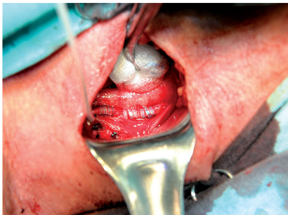
Ryc. 1. Elektroda założona na lewy nerw błędny Fig. 1. Electrode set up on the left vagus nerve