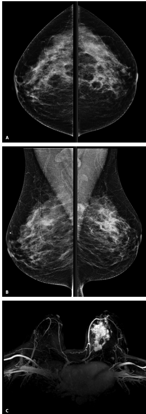
Rycina 2. Chora lat 30. Pierś lewa: invasive carcinoma NST N2, NG2. A. Mammografia projekcja CC; B. Mammografia projekcja MLO — w piersi lewej przy ścianie klatki piersiowej zagęszczenie o maksymalnym wymiarze do 18 mm; C. Badanie MR piersi — rekonstrukcja MIP ( maksimum intensity projection ). W piersi lewej w kwadrancie górnym-wewnętrznym i na pograniczu kwadrantów górnych nieregularnego kształtu naciek o maksymalnych wymiarach 66 mm × 46 mm × 52 mm