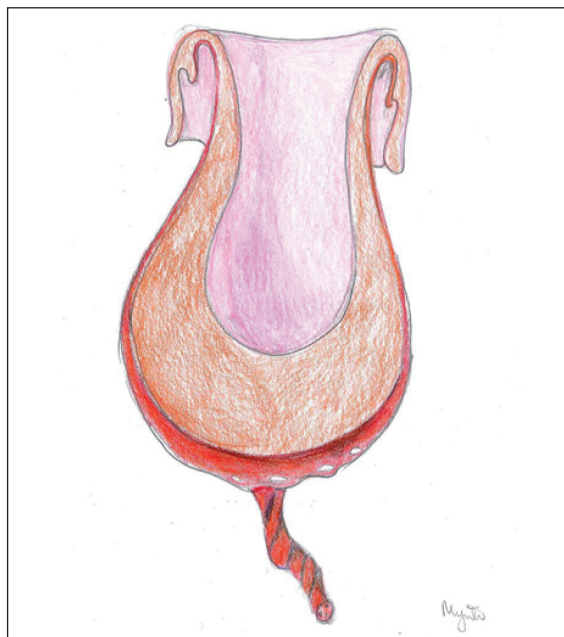
Rycina 2. Całkowite wycięcie macicy (autor: Małgorzata Mynte)

natury noworodka płci żeńskiej o ciężarze ciała 3300 g ocenionego na 10 punktów w skali Apgar.