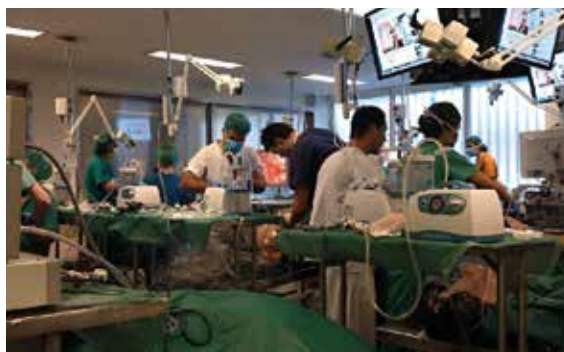
Rycina 3. Warsztaty zastosowania chirurgii laparoskopowej w ginekologii onkologicznej (Madryt, Hiszpania)