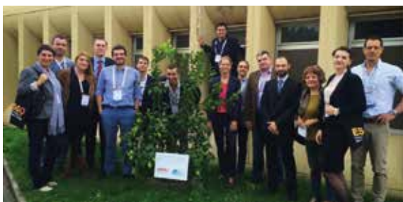
Rycina 4. Członkowie ENYGO wraz z zasadzonym przez nich drzewem (Nicea, Francja)