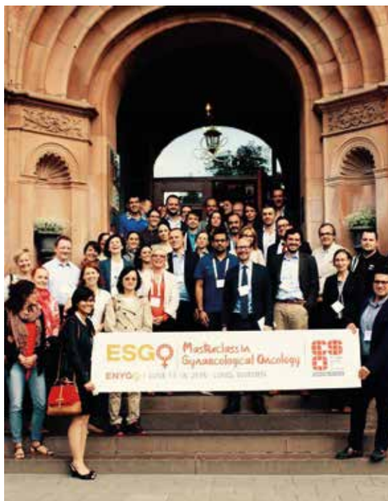
Rycina 1. Uczestnicy spotkania ESGO-ENYGO-ESMO Masterclass w 2016 roku (Lund, Szwecja)

Każdy członek ESGO, który nie przekroczył 40. roku życia lub jest w trakcie specjalizacji, staje się automatycznie członkiem ENYGO