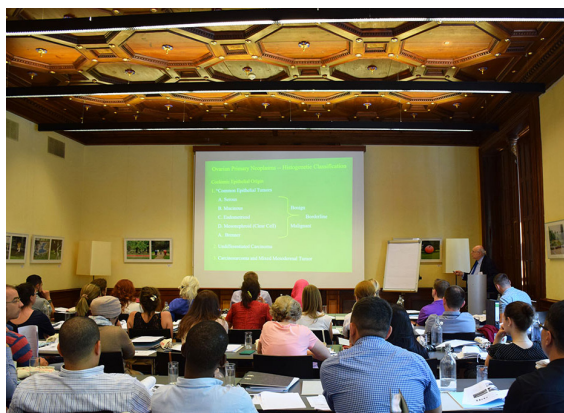
Rycina 4. Wśród wykładowców znajdują się czołowi specjaliści w swoich dziedzinach z Europy i Stanów Zjednoczonych

osób zainteresowanych nauką nowych technik laboratoryjnych, nawiązaniem współpracy naukowej lub realizacją projektu badawczego jest ubieganie się o 3-miesięczne stypendium badawcze OMI. Organizatorzy zapewniają zakwaterowanie oraz kieszonkowe na czas pobytu w ośrodku goszczącym.