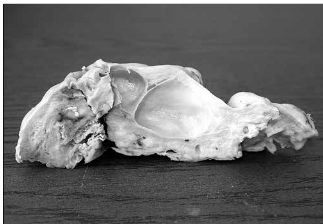
Rycina 2. Przestrzenie torbielowe na przekroju poprzecznym guza.