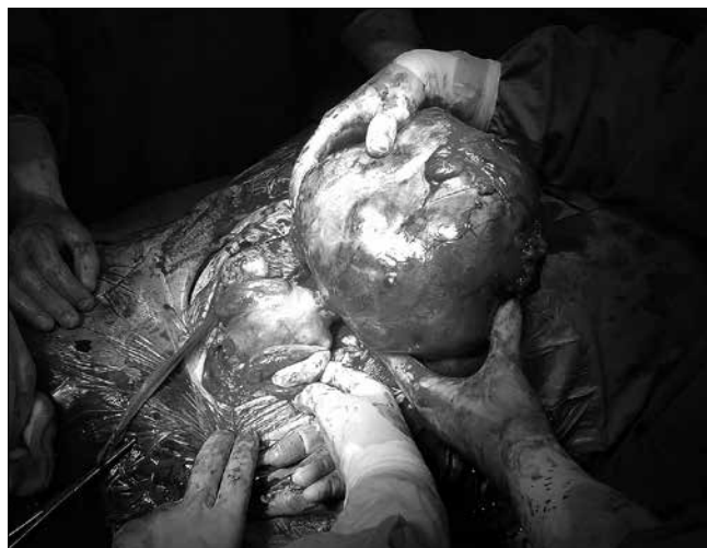
Rycina 1. Uszypułowany mięśniak macicy.

Mięśniaki macicy to monoklonalne guzy rozwijające się z pojedynczej, niezróżnicowanej komórki mezenchymalnej. Składają się w różnej proporcji z tkanki mięśniowej i łącznej [4]. Są najczęstszym nowotworem kobiecego narządu płciowego, występują u 20–40% kobiet w wieku rozrodczym [5, 6, 7, 8].