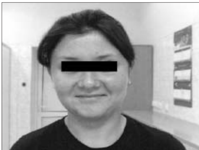
Rycina 3. Ta sama pacjentka lat 18, masa ciała 69,5 kg, wzrost: 165cm, BMI-26 kg/m 2 , VI. 2007.

Odnotowano powrót cykli miesięczkowych z owulacją oraz z rozwojem wtórnych cech płciowych. Masa ciała przy przyjęciu: 69,5kg, wzrost: 165cm, BMI-26kg/m 2 .