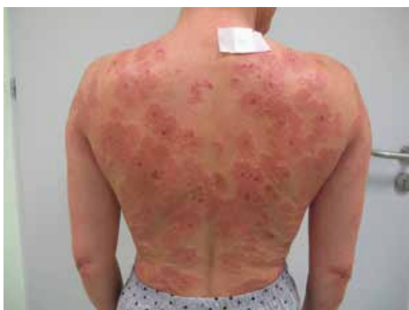
Rycina 2. Zmiany rumieniowo-obrzękowe z nadżerkami i pęcherzykami na plecach pacjentki