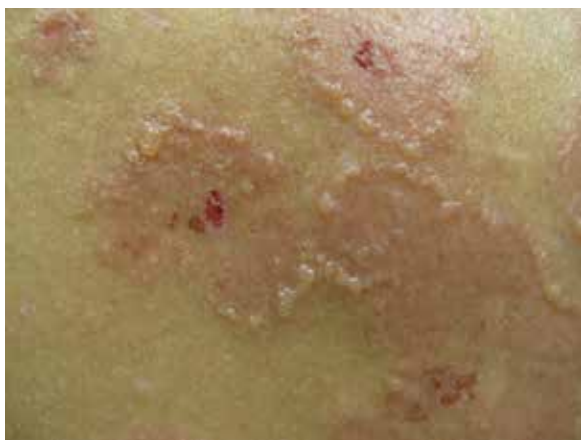
Rycina 1. Wykwity rumieniowo-obrzękowe o obrączkowatym układzie, z nadżerkami na powierzchni i licznymi pęcherzykami na obwodzie