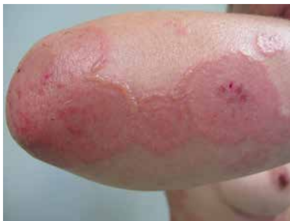
Rycina 3. Wykwity rumieniowo-obrzękowe z nadżerkami oraz pęcherzykami na obwodzie okolica łokci