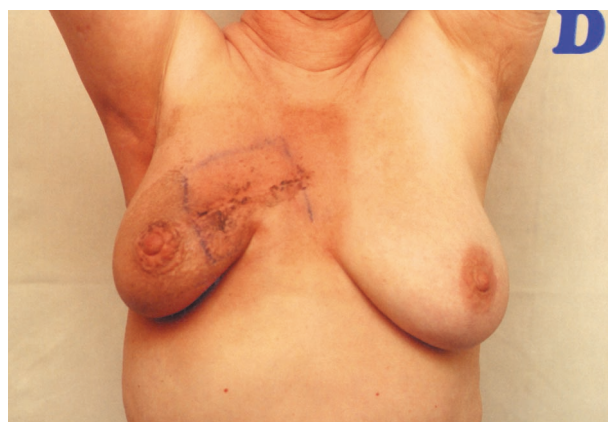
Ryc. 1. Efekt kosmetyczny leczenia oszczędzającego piersi a) bardzo dobry, b) dobry, c) dostateczny, d) zły