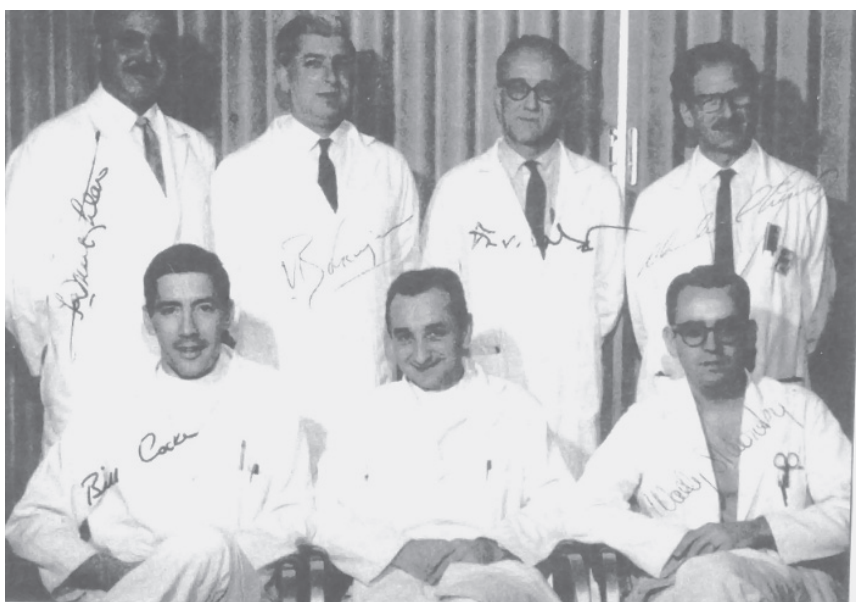
Ryc. 1. Zespół H&N(B) – RPMI w Buffalo (1965 r.)