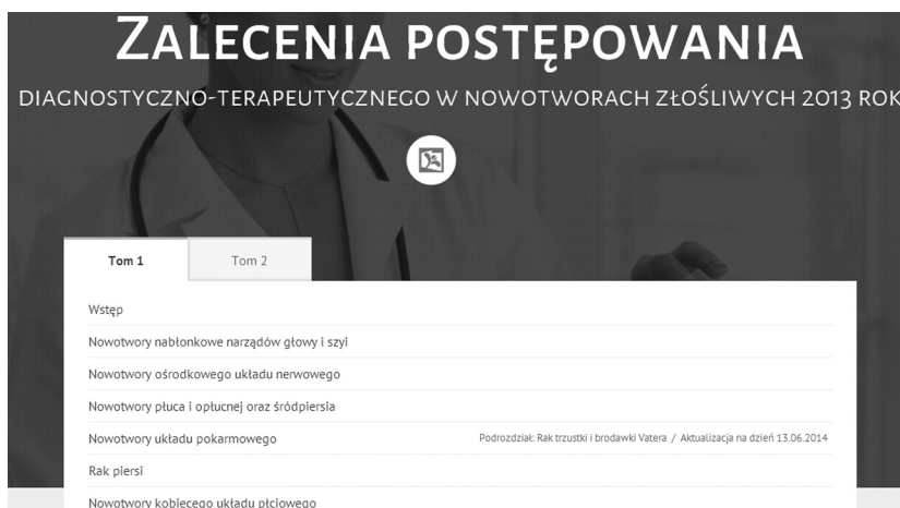
Rycina 1. Fragment strony zawierającej elektroniczną wersję książki „Zalecenia postępowania...”, opracowanej pod auspicjami PTOK

Strona zawierająca zalecenia PTOK nie została sformatowana z myślą o urządzeniach mobilnych, takich jak smartfony lub tablety, niemniej jednak wyświetlenie i nawigacja po