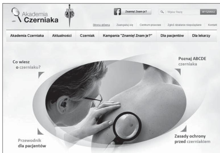
Rycina 1. Strona główna serwisu Akademia Czerniaka (sekcji naukowej Polskiego Towarzystwa Chirurgii Onkologicznej)

W następnej zakładce widocznej na głównej belce („Czerniak”) oraz w zakładce „Dla pacjentów” zamieszczono podstawowe informacje o charakterze edukacyjnym (np. dane epidemiologiczne odnoszące się do czerniaka w naszym kraju, system ABCDE służący do prostej oceny znamion skórnych, elementarne zasady ochrony skóry przed szkodliwym wpływem promieniowania słonecznego, odpowiedzi na pytania często zadawane przez pacjentów itp.). Materiały dostępne w tej części strony internetowej Akademii Czerniaka przygotowano w przejrzysty i przystępny sposób, co czyni je wartościowym źródłem informacji zrozumiałych także dla nielekarzy. Dodatkowo w omawianych częściach serwisu można odnaleźć listę polskich ośrodków zajmujących się w sposób kompleksowy diagnostyką i leczeniem czerniaka (zarówno ośrodki dermatologiczne,