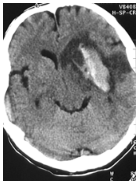
Rycina 2. Mężczyzna K.T., lat 50. Ukrwotocznienie o charakterze krwiaka wewnątrzżawłowego; badanie CT wykonano w Pracowni Tomografii Komputerowej Szpitala im. T. Marciniaka

Ukrwotocznienie wybroczynowe (HI) i krwiak wewnątrzżawłowy (PH, parenchymal hematoma ) mają odmienny patomechanizm, morfologię i znaczenie kliniczne. Ukrwotocznienie wybroczynowe zwykle występuje w rozległych zawałach mózgu, którym towarzyszy na początku znaczny