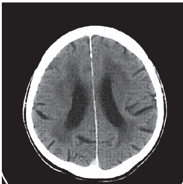
Rycina 1. Obraz tomografii komputerowej: leukoarajozu u pacjenta z zaburzeniami czynności poznawczych