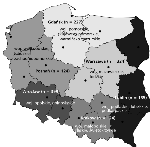
Rycina 1. Podział na regiony (w nawiasach podano liczbę lekarzy, którym zaproponowano udział w badaniu)

Udział w badaniu zaproponowano 1353 lekarzom pracującym w lecznictwie otwartym w 5 regionach Polski. W tabeli 1 przedstawiono liczbę lekarzy, którym zaproponowano udział w badaniu ankietowym, uwzględniając podział na regiony (ryc. 1). Średnio na