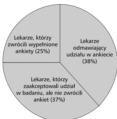
Rycina 2. Analiza postaw lekarzy wyrażona jako częstość akceptacji lub odmów udziału w badaniu; liczba lekarzy, którym zaproponowano udział w ankiecie, wynosiła 1353

jeden region przypadało około 225,5 lekarzy. Spośród lekarzy, którym zaproponowano przeprowadzenie ankiet, 38% odmówiło udziału w badaniu. Pozostałe 62% wyraziło na to zgodę. Jednak mimo wstępnej akceptacji uczestnictwa w badaniu aż 59,18% lekarzy nie zwróciło wypełnionych ankiet. Łącznie 1013 lekarzy spośród 1353, którym zaproponowano udział w badaniu, albo od razu, albo po pewnym czasie rezygnowało z udziału w badaniu. Wypełnione ankiety zwróciło jedynie 340 lekarzy, co stanowi 25,12% ogółu zaproszonych do udziału w badaniu (ryc. 2). Największa liczba lekarzy, którzy przeprowadzili ankiety, pracuje na terenie regionów pomorskiego (38,33%) oraz małopolskiego (30,65%). Zdecydowanie najgorsze wyniki stwierdzono w regionie Dolnego Śląska, gdzie na udział w ankiecie zdecydowało się jedynie 9,28% lekarzy. W tabeli 2 i na rycinie 3 przedstawiono dane dotyczące postaw lekarzy z uwzględnieniem podziału na specjalizacje. Największy odsetek odmów udziału w ankiecie (86,5%) cha-