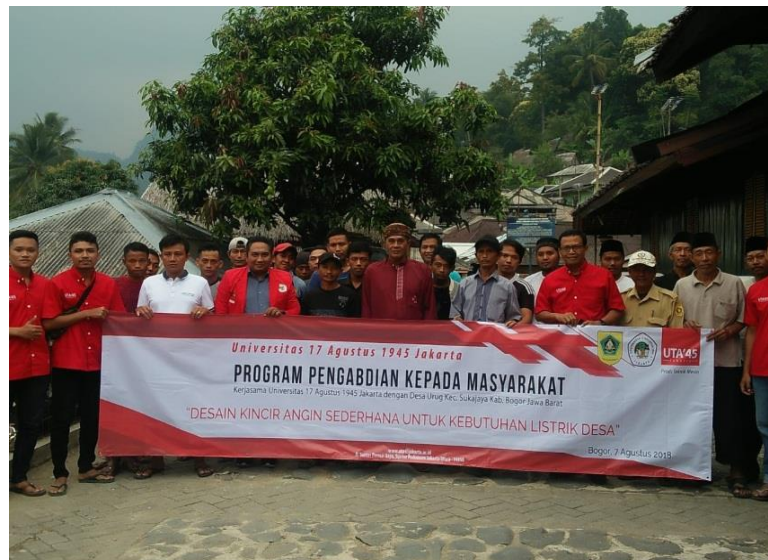
Gambar 1. Tim Pengabdian dan sebagian Audience peserta pelatihan