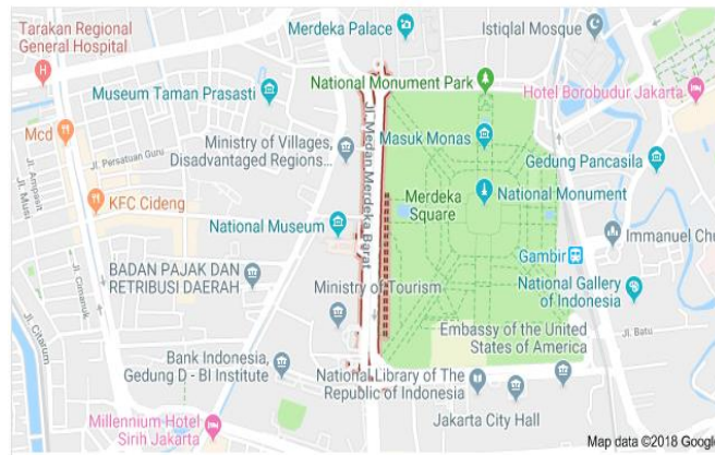
Gambar 1. Peta Ruas Jalan Medan Merdeka Barat, DKI Jakarta