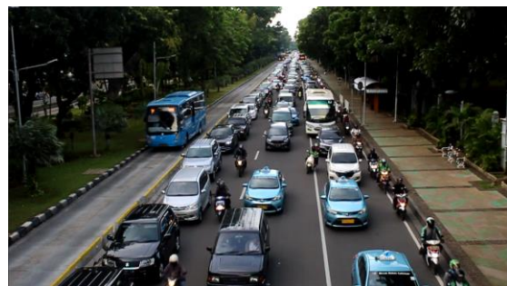
Arus Lalu Lintas Dari Arah Utara