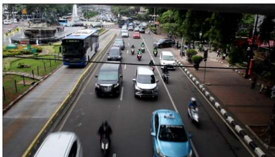
Arus Lalu Lintas Dari Arah Selatan