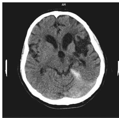
Rycina 1. Tomografia komputerowa głowy w dniu przyjęcia na oddział neurologii

W badaniu TK głowy uwidoczniło się obecność krwi wokół namiotu mózdzku, poza tym przewlekłe zmiany naczyniopochodne w okolicy okołokomorowej oraz jamy malacyjne w lewej półkuli mózgu po przebytych wcześniej udarze (ryc. 1).