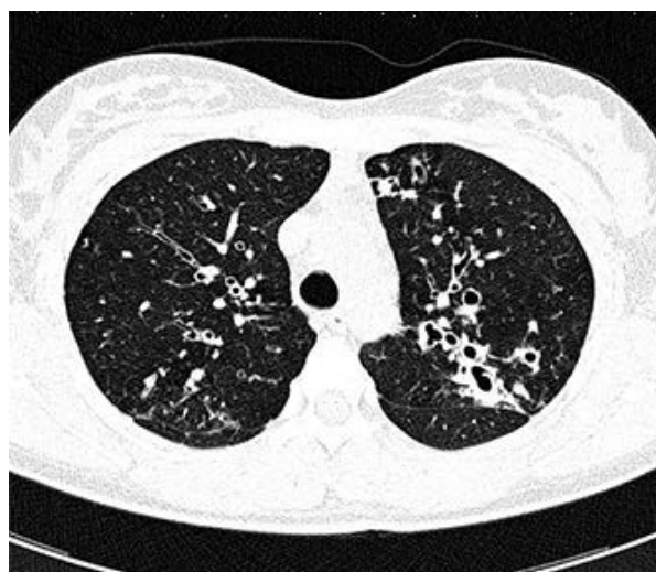
Rycina 2. Tomografia komputerowa wysokiej rozdzielczości płuc (05.04.2011). Proksymalne rozstrzenie oskrzeli dominujące w płacie górnym lewym

Figure 1. Posteroanterior chest X-ray. Diffuse linear and nodular opacities predominantly proximal