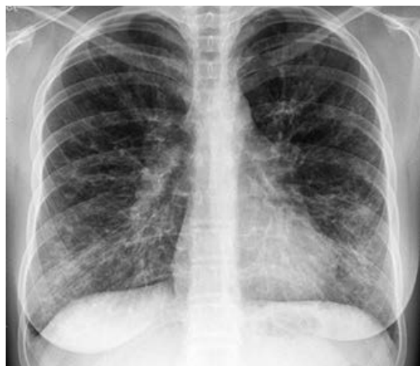
Rycina 1. Zdjęcie klatki piersiowej PA. Rozsiane zmiany linijne i guzkowe dominujące w centralnych partiach płuc

Figure 1. Posteroanterior chest X-ray. Diffuse linear and nodular opacities predominantly proximal