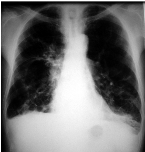
Rycina 2. Rozstrzenie oskrzeli oraz cechy nadciśnienia płucnego (u omawianego chorego)