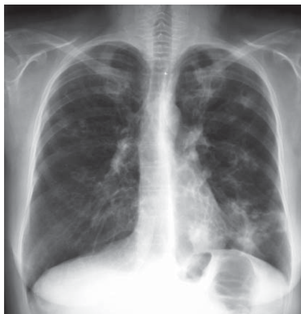
Rycina 1. Radiogram klatki piersiowej

Z wydzieliny oskrzelowej wyhodowano Pseudomonas aeruginosa — szczep wytwarzający \beta -laktamazy o rozszerzonym spektrum działania (ESBL,