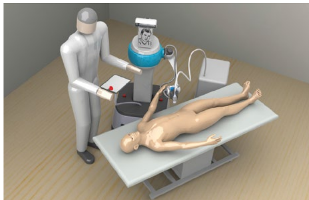
Rycina 2. Model systemu ReMeDi po stronie pacjenta

Zdalnie sterowany robot będzie charakteryzował się częściową autonomią pod względem poruszania się i pokonywania przeszkód, jak również możliwością samodzielnego budowania mapy pomieszczeń, w których będą wykonywane badania. Będzie to umożliwiało samodzielne lub też częściowo samodzielne dotarcie robota na miejsce badania. Wyposażenie robota w system kamer przekazujących obrazy w technologii 2D i 3D w wysokiej rozdzielczości, jak i mikrofonów do transmisji dźwięku zapewni kontakt wzrokowy i dźwiękowy z badanym. Kluczowe jest jednak zastosowanie złożonego interfejsu dotykowego (haptycznego), przekazującego uczucie dotyku oraz siły wywieranej na ciało pacjenta. Stworzenie tego rodzaju systemu haptycznego będzie umożliwiało zdalne wykonanie podstawowych i praktycznie niemożliwych do zastąpienia technik badania — osłuchiwania i palpacji oraz echokardiografii u pacjenta wymagającego szybkiej specjalistycznej interwencji, na przykład w przypadku ostrej niewydolności serca lub rozwarstwienia aorty. Badanie echokardiograficzne będzie prowadzone dzięki interfejsom haptycznym z pełnym wyczuciem tkanek pacjenta i pewnemu prowadzeniu głowicy echokardiograficznej. Rozszerzeniem badania może być oczywiście podstawowe badanie ultrasonograficzne jamy brzusznej lub też inne badania ultrasonograficzne, ponieważ system ma zapewniać możliwość wymiany głowic. Należy podkreślić, że działania z wykorzystaniem systemu robotycznego