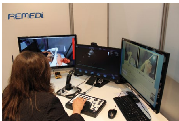
Rycina 4. Obecny wygląd systemu ReMeDi — panel sterowania lekarza

ReMeDi odbywać się będą w czasie rzeczywistym, co dotyczy nie tylko systemu telekonferencyjnego, ale przede wszystkim badania palpacyjnego i ultrasonograficznego. Specjalista prowadzący badanie zdalnie dysponował będzie zestawem monitorów wizualizujących pacjenta oraz przekazujących dane badania. Pacjent natomiast będzie miał pełny kontakt wizualny i werbalny z lekarzem. Z uwagi na konieczność pełnego zabezpieczenia pacjenta badanie będzie przeprowadzane w obecności asystenta [17]. Projekt ReMeDi znacząco wybiega w przyszłość i prawdopodobnie ma szanse stanowienia podłoża dla innych systemów opartych na podstawowych przecież dla człowieka, a w szczególności dla lekarza zmysłach. Projekt wchodzi obecnie w stadium końcowe. Jest już możliwe przeprowadzenie zdalnego