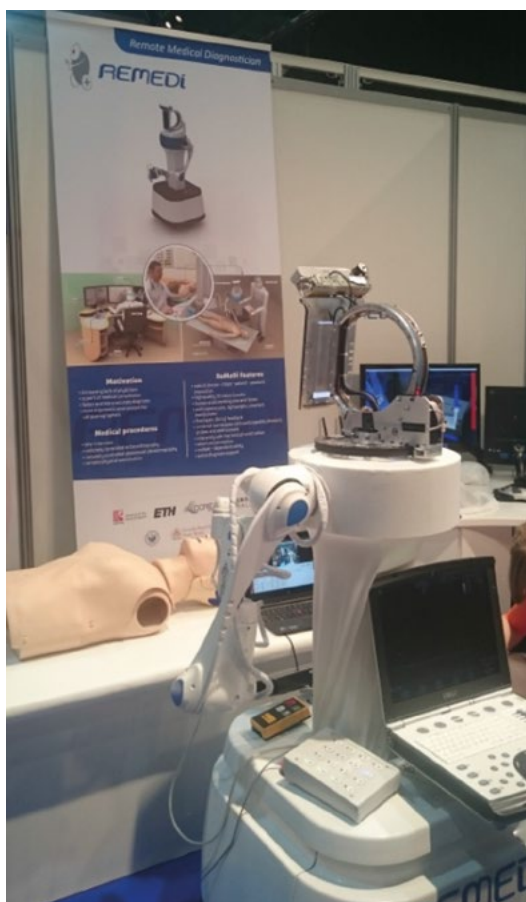
Rycina 3. Obecny wygląd systemu ReMeDi — robot z zamontowanym aparatem do ultrasonografii