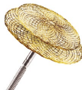
Rycina 4. Zapinka CeraFlex (Lifetech Sciences)