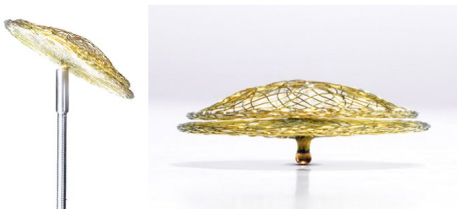
Rycina 3. Zapinka Occlutech Flex II PFO Occluder (Occlutech)

Do tej pory w piśmiennictwie ukazały się dwie prace obserwacyjne oceniające zastosowanie tej zapinki w zamknięciu PFO u pacjentów po prze-