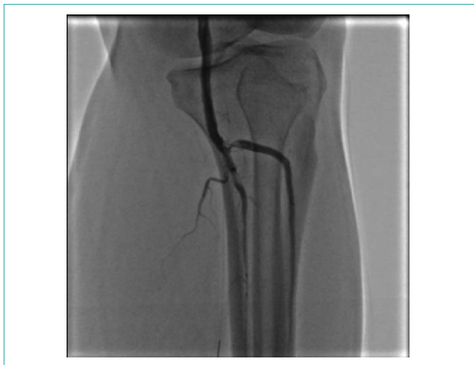
Рисунок 4. Остаточные тромботические массы, с кровотоком ТИМІ 2 Figure 4. Residual thrombus (TIMI 2 flow)