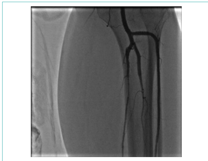
Рисунок 5. Селективная ангиография артерий левой голени после стентирования Figure 5. Selective angiography of the left lower leg arteries, post stenting