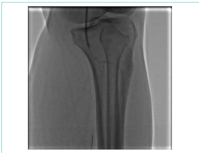
Рисунок 2. Проведение проводников в дистальное русло Figure 2. Guidewire in the distal

продолжительности ишемии, неврологического дефицита, сопутствующих заболеваний и связанных с лечением рисков и его результатов. Эндоваскулярные операции на артериях голени чаще всего показаны для спасения конечности. Увеличивается количество рекомендаций в пользу эндоваскулярной операции на артериях голени у больных с критической ишемией конечности [2, 8–10]. Эндоваскулярные операции при первичном заболевании показывают хороший результат и высокую эффективность на артериях нижних конечностей на всех уровнях поражения [11–13]. В связи с развитием техники выполнения эндоваскулярных операций, а также совершенствованием инструментария улучшаются результаты лечения, сокращается частота осложнений и, следовательно, пребывание в стационаре. Все это дает эндоваскулярным вмешательствам больше преимуществ, даже в тех областях, которые раньше считались прерогативой сосудистой хирургии [14–16].