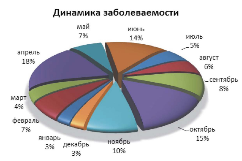
Рисунок 1. Динамика заболеваемости ИСМП в течение года г. Казани (абс. случаи) Figure 1. Annual dynamics of HAIs morbidity in Kazan (absolute number of cases)

Сравнивая результаты проведенных нами исследований с материалами литературных данных, стоит отметить, что в Республике Татарстан структура внутрибольничных инфекций (ВБИ) специфична по сравнению с другими регионами РФ. Так, например, в г. Челябинске лидирующую позицию в структуре ИСМП занимают послеоперационные гнойно-септические инфекции (ГСИ); в Приморском крае — острые кишечные инфекции (ОКИ), в то время как в г. Казани не зарегистрировано ни одного случая послеоперационных ГСИ, а ОКИ принадлежит далеко не первое место [3, 11]. Или, например, в Казани высокий удельный вес ВБИ зарегистрирован в детских отделениях многопрофильных медицинских учреждений (93,1 % случаев), а на территории других субъектов РФ наибольшее количество случаев исследователи отмечают в хирургических стационарах и учреждениях родовспоможения [12]. В Рязанской