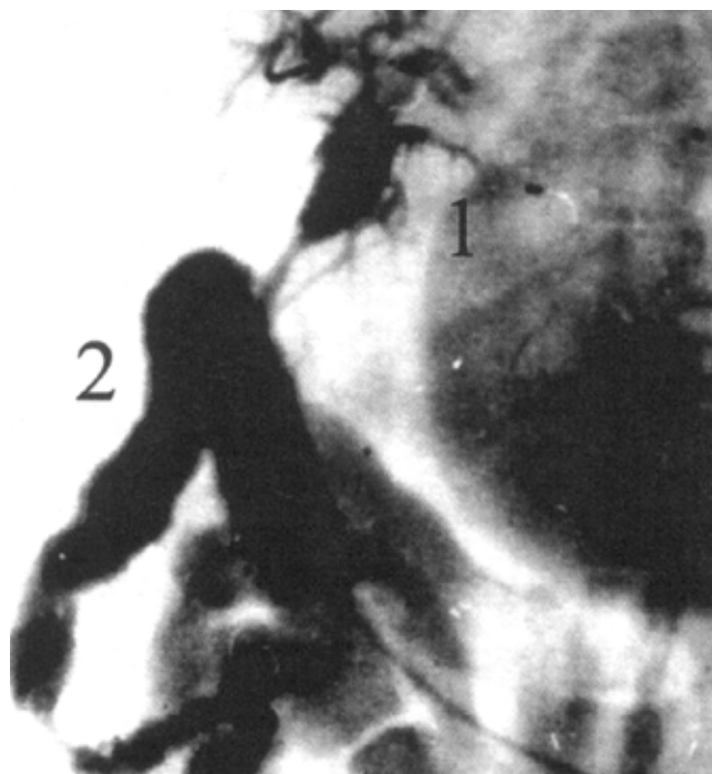
Рис. 2. Проходимость гепатикоеюноанастомоза с трубчатым лоскутом тощей кишки. Холангиограмма. Срок наблюдения – 6 месяцев. 1 – гепатикоеюноанастомоз, 2 – тощая кишка

указывали на хорошую проходимость анастомозов и отсутствие билиарной гипертензии, а колебания манометрического давления в рамках физиологических величин – на их сфинктерные свойства.