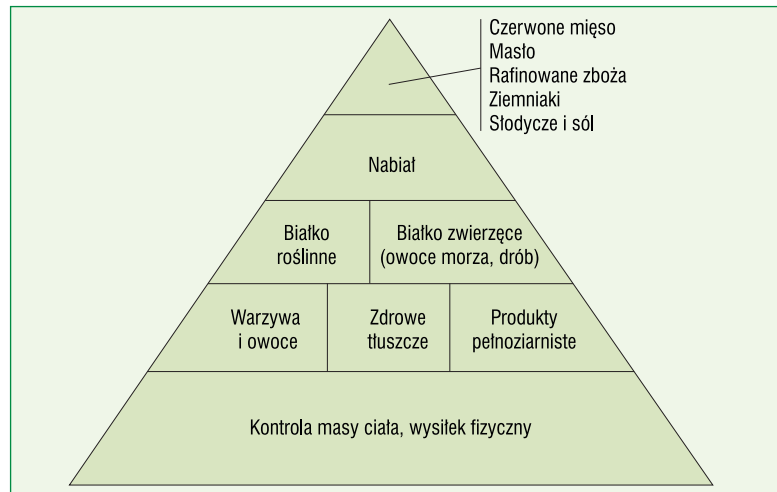
Rycina 2. Harwardzka piramida żywienia

znaczenie podaży białka dla podtrzymania prawidłowego stopnia odżywienia organizmu i przemian metabolicznych. Szczyt piramidy (oddzielony wyraźnie od podstawy) stanowią produkty, które powinny być spożywane sporadycznie, w tym czerwone mięso, przetworzone wędliny, ziemniaki, rafinowane produkty zbożowe, jak biały ryż, makaron, chleb, słodycze i słodkie napoje oraz sól. Alkohol zaleca się spożywać okazjonalnie i wybiórczo. Wytyczne zalecają suplementację witaminy D 3 . Zgodnie z wynikami najnowszych badań nad metabolizmem człowieka i rolą substancji odżywczych, harwardzkie wytyczne żywieniowe stanowią nie tylko przełom w nauce o żywieniu, ale również wytyczają nową drogę prewencji chorób dietozależnych.