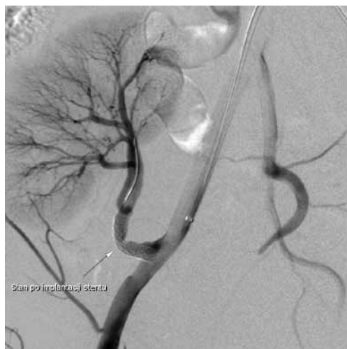
Rycina 5. Angiogram po implantacji stentu wykazuje prawidłowe rozprężenie i prawidłowe umiejscowienie stentu. Prawidłowa drożność pnia tętnicy nerkowej i gałęzi obwodowych

tętnicy są mniej podatne na samą angioplastykę balonową. Zastosowanie w takich przypad-