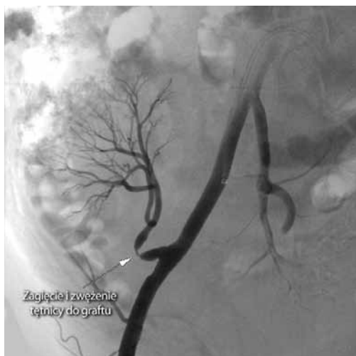
Rycina 1. Angiogram diagnostyczny uwidaczniający krytyczne zwężenie oraz zagięcie pnia tętnicy nerkowej nerki przeszczepionej