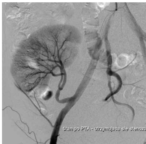
Rycina 4. Na angiogramie kontrolnym po PTA widoczna utrzymująca się stenozę powyżej 50% średnicy światła