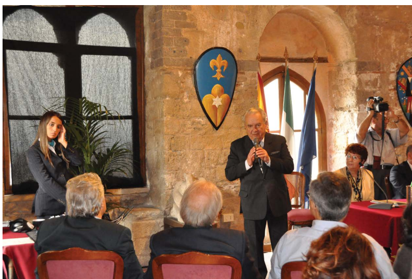
Rycina 4. Profesor Mirosław Mydlik w czasie wykładu podczas konferencji nefrologicznej w Taorminie we Włoszech w 2012 roku