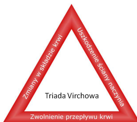
Rycina 1. Triada Virchowa

Poziom fibrynolizy stopniowo zmniejsza się w czasie ciąży, co jest związane ze zwiększonym poziomem inhibitora aktywatora plazminogenu (PAI)-1 i łóżyskowej produkcji PAI-2 [21–23].