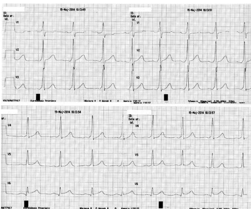
Rycina 2. Spoczynkowy zapis EKG. Cechy jawnej preekscytacji

styki elektrofizjologicznej wynosił od 2 do 18 lat (średnio 13 lat). Inwazyjne badanie elektrofizjologiczne wykazało, że podłożem arytmii u 33 dzieci (55%) była obecność drogi dodatkowej (jawnej lub utajonej), u 16 dzieci (27%) nawrotny częstoskurcz węzłowy przedsionkowo-komorowy, a u 11 (18%) ektopiczny częstoskurcz przedsionkowy. U dziewięciorga dzieci wystąpił nawrót arytmii, u sześciorga z częstoskurczem przedsionkowym i u trojga z jawną drogą dodatkową. Po powtórnym zabiegu sześciorgo z nich pozostaje bezobja-