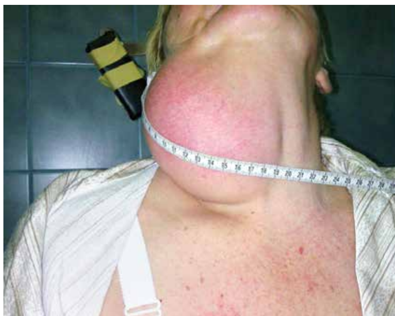
Rycina 1. Olbrzymi tłuszczak szyi

Zmniejszenie wielkości guza można osiągnąć poprzez lipolizę iniekcyjną, jednak ta metoda nie powoduje całkowitego wyeliminowania guza. Polega ona na podaniu do guza związków fosfatydylochliny, która działa jak detergent i uszkadza błony komórkowe adipocytów [13]. Innymi lekami, które można podać do wnętrza tłuszczaka są glikokortykosteroidy. Powodują one miejscowy zanik tkanki tłuszczowej i w rezultacie zmniejszenie rozmiarów guza [2]. Uzyskanie dobrego efektu kosmetycznego umożliwia