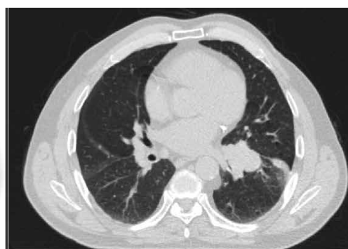
Rycina 1. Silne gromadzenie fluorowanej deoksyglukozy w raku płaskonabłonkowym lewego płuca