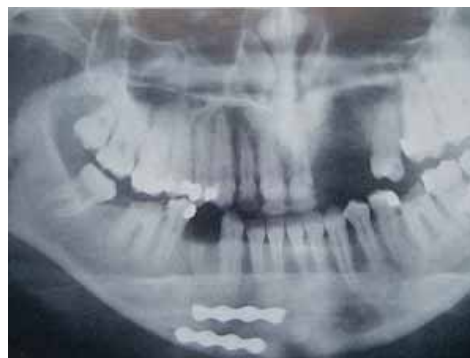
Rycina 9. Zdjęcie panoramiczne — osteosynteza minipłytkowa trzonu żuchwy

Nadal jednak wiele zależy od lekarza pierwszego kontaktu, jakim jest lekarz rodzinny lub stomatolog. Znajomość podstawowych zagadnień traumatologii szczękowo-twarzowej może przyczynić się do skrócenia czasu dotarcia chorego do ośrodka specjalistycznego.