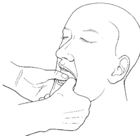
Rycina 5. Badanie ruchomości żuchwy