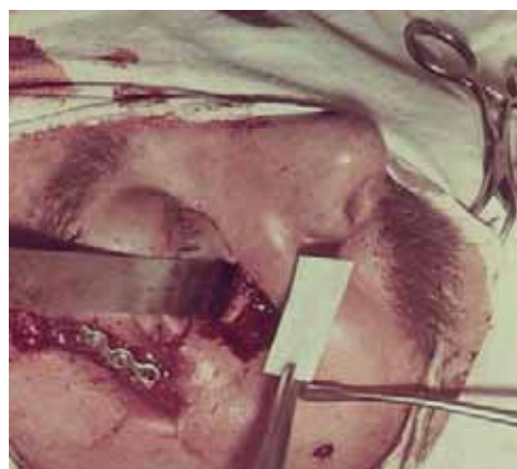
Rycina 10. Leczenie operacyjne złamania jarzmowo-szczękowego — odtworzenie ciągłości bocznego filaru twarzoczaszki i rekonstrukcja dna oczodołu