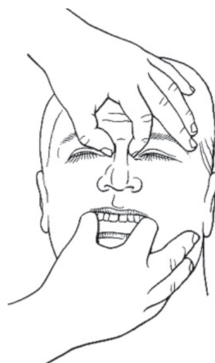
Rycina 6. Badanie ruchomości szczęki

Ciągłość szkieletu twarzowego ocenia się na podstawie badania oburęcznego. W obrębie żuchwy polega ono na uchwyceniu palcami wskazującymi ułożonymi na zębach trzonowych i kciukami pod trzonem żuchwy. Następnie delikatnym naprzemiennym ruchem ocenia się ruchomość w liniach złamań (ryc. 5). Złamanie w obrębie uzębionego łuku często uwidacznia się zaburzeniem przebiegu łuku zębowego (wyraźny schodek) i obecnością rany błony śluzowej. Tu należy