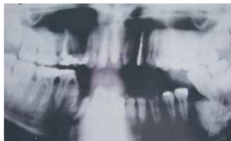
Rycina 7. Zdjęcie panoramiczne — złamanie trzonu żuchwy

Dalsza diagnostyka radiologiczna wymaga specjalistycznych projekcji dla oceny stawów skroniowo-żuchwowych, łuków jarzmowych, oczodołów. Niezwykle pomocna jest