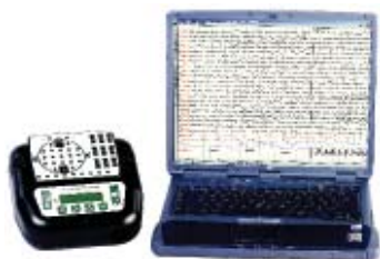
Rycina 1. Aparat Comet EEG z komputerem typu notebook firmy Grass

Bezpośrednio po napadzie padaczkowym badanie EEG rejestruje lokalne lub uogólnione zwolnienie czynności mózgu.