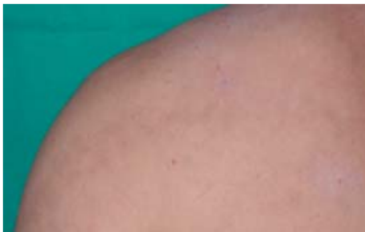
Rycina 1. Zespół Moulina