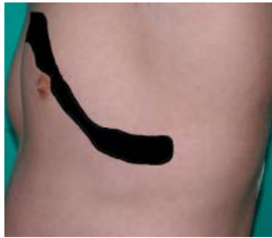
Rycina 4. Zespół Moulina — przebieg zmian skórnych wzdłuż linii Blaschko