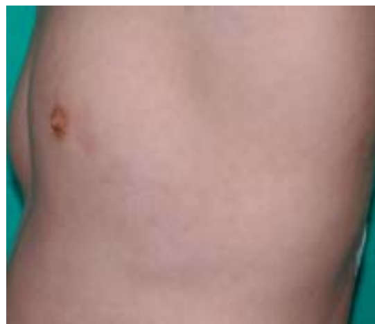
Rycina 2. Zespół Moulina

Obraz histopatologiczny MS nie jest zawsze jednorodny [2, 7, 8]. W obrębie warstwy podstawnej naskórka może być widoczna akumulacja pigmentu. Budowa i grubość skóry właściwej nie jest zmieniona.