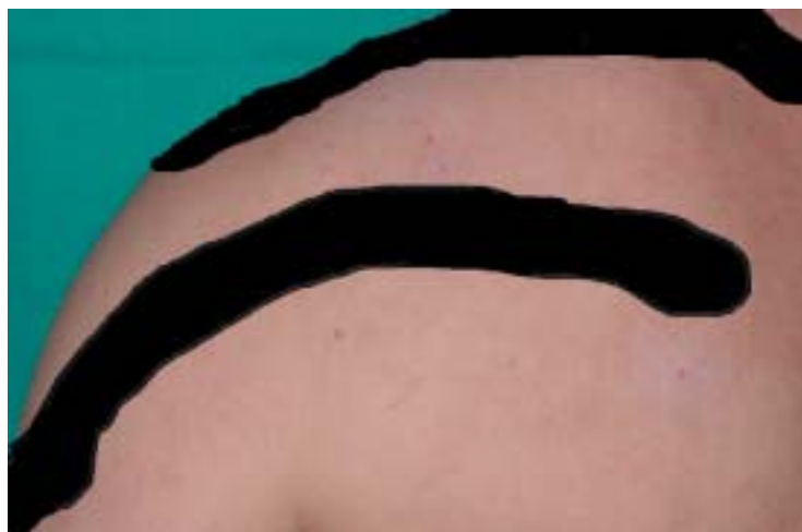
Rycina 3. Zespół Moulina — przebieg zmian skórnych wzdłuż linii Blaschko