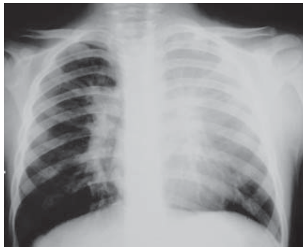
Rycina 6. RTG klatki piersiowej PA (9.11.2006)

42 mm × 46 mm poprzecznie i 43 mm (PA), która nieznacznie przemieszczała do przodu oskrzele górnopłątowe prawe. W obrębie torbieli nie było płynu. Jamy opłucnowe były wolne, węzły chłonne wnek i śródpiersia niepowiększone. Po otrzymaniu opisu tomografii klatki piersiowej podjęto decyzję wykonania zabiegu operacyjnego usunięcia torbieli pozapalnej (4.08.09). W badaniu histopatologicznym rozpoznano pseudotorbiel o średnicy 3 cm o gładkiej, połyskliwej ścianie z cechami ogniskowej niedodmy.