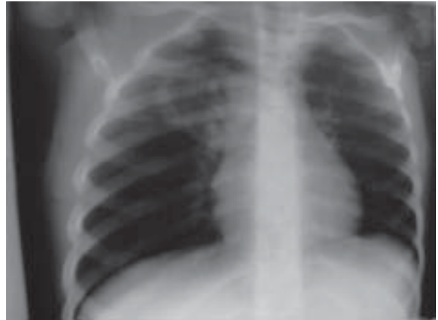
Rycina 2. RTG klatki piersiowej PA (24.04.08)