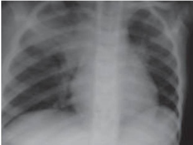
Rycina 1. RTG klatki piersiowej PA (29.03.08)