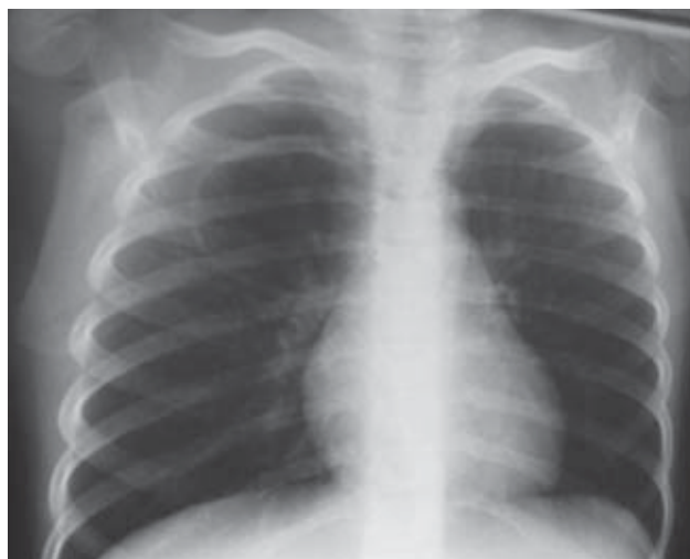
Rycina 5. RTG klatki piersiowej PA (18.06.08)