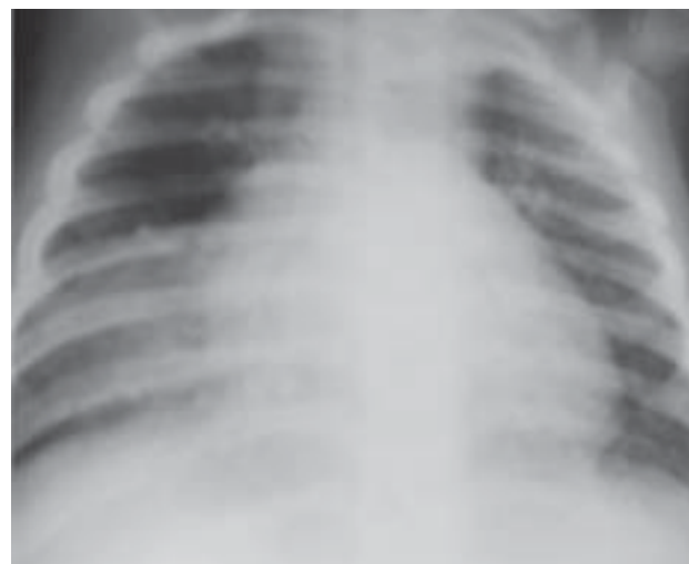
Rycina 8. RTG klatki piersiowej PA i boczne prawe (21.12.2006)

płucnymi obecność licznych furczeń i rzężeń średniobańkowych oraz wydłużonego wydechu. W badaniach laboratoryjnych: niskie parametry stanu zapalnego, prawidłowa leukocytoza, rozmaz granulocytarny, saturacja w granicach 88%. W zdjęciu radiologicznym PA klatki piersiowej stwierdzono obecność zacinienia w polu płata środkowego płuca prawego (26.11.2007 — ryc. 7). Wykluczono zakażenie patogenami atypowymi: Mycoplasma i Chlamydia pneumoniae , Chlamydia trachomatis , a ponadto Pneumocystis carini . W badaniu bakteriologicznym wydzieliny z drzewa oskrzelowego uzyskano florę fizjologiczną. Zastosowana antybiotykoterapia szerokospektralna, bronchodylatory i steroidy wziewne oraz rehabilitacja układu oddechowego spowodowały wyraźną redukcję wydzieliny w drzewie oskrzelowym i zmniejszenie kaszlu; utrzymywały się jednak zmiany osłuchowe w postaci rzężeń drobnobańkowych nad polem płuca prawego. W kontrolnym radiogramie płuc tylnoprzodnym stwierdzono utrzymywanie się zacinienia w płacie środkowym płuca prawego i górnym biegunie wnęki prawej. Zdjęcie boczne prawe wykazało obecność w segmencie 5. płuca prawego cienia okrągłego o średnicy około 6 cm, o echogeniczności tkankowej