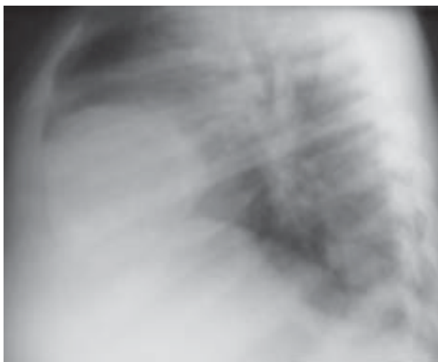
Rycina 9. RTG klatki piersiowej boczne prawe (21.12.2006)

Dyskusyjny wydaje się fakt, czy ciężki stan wynikał z nałożenia się aspiracyjnego zapalenia płuc i zakażenia mieszanego bakteriami typową i atypową, czy wynikał z nadkażenia mieszanego wcześniej już istniejącej torbieli wrodzonej? Odpowiedź na to pytanie uzyskano dopiero po badaniu histopatologicznym materiału pobranego podczas zabiegu operacyjnego. Torbiel okazała się torbielą pozapalną — zejściem po ropniu płuca. Z całą pewnością w jednym przypadku mieliśmy do czynienia z etiologią mieszaną zakażenia — na co wskazywałyby wysokie wskaźniki stanu zapalnego. W przypadku zakażeń wyłącznie atypowych, wskaźniki stanu zapalnego są niskie. Ropień płuca jest najczęściej wynikiem zakażenia gronkowcem lub pneumokokiem. Ewolucja zaś przeciwciał w klasie IgG w kierunku Mycoplasma pneumoniae nakazuje myśleć o istniejącym zakażeniu atypowym. Niewykluczone, że w opisanym przez autorów artykule przypadku doszło do zakażenia mieszanego bakteriami typowymi i atypowymi na