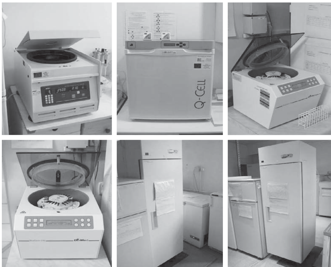
Rycina 4. Specjalistyczna aparatura laboratoryjna w Instytucie Hematologii i Transfuzjologii w Warszawie