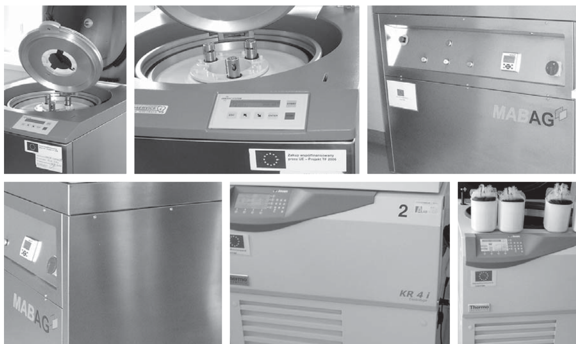
Rycina 3. Specjalistyczna aparatura laboratoryjna w Regionalnym Centrum Krwiodawstwa i Krwiolecznictwa w Krakowie