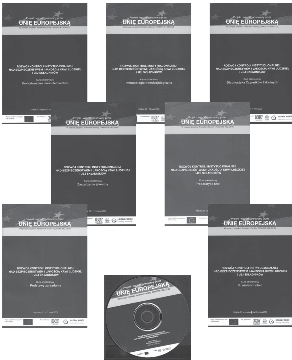
Rycina 8. Okładki książek i płyta CD opracowane i wydane w ramach Kontraktu 1