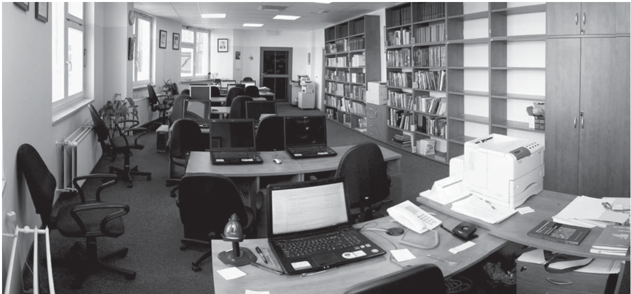
Rycina 5. Sala szkoleniowa w Instytucie Hematologii i Transfuzjologii w Warszawie