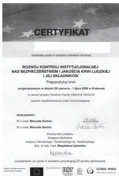
Rycina 1. Certyfikat ukończenia kursu