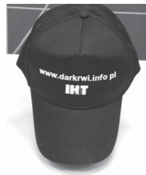
Rycina 7. Materiały promocyjne – plakat i czapeczka z logo strony internetowej www.darkwi.info.pl