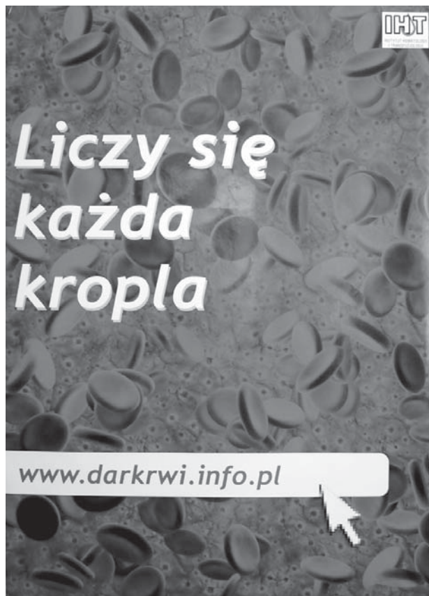
Figure 6. Website for blood donors: www.darkwi.info.pl