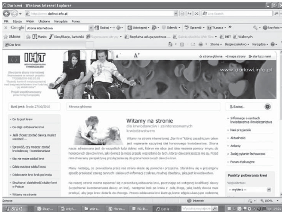
Rycina 6. Strona internetowa dla krwiodawców: www.darkwi.info.pl