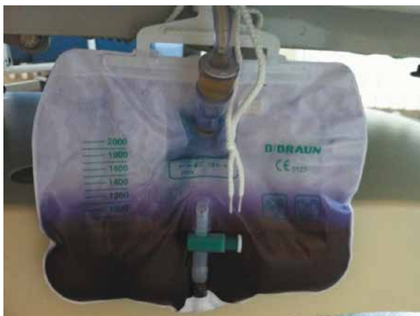
Rycina 1. Worek na mocz u pacjenta z zespołem fioletowego worka na mocz

Zespół fioletowego worka na mocz może wystąpić u pacjentów z wielochorobowością, przewlekle leżą-