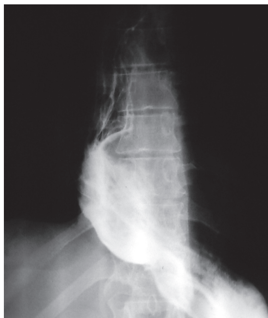
Rycina 2. Kontrola radiologiczna bezpośrednio po implantacji stentu — widoczny prawidłowy pasaż kontrastu do żołądka Figure 2. X Ray contrast control immediately after stent implantation (proper contrast flow into the stomach)