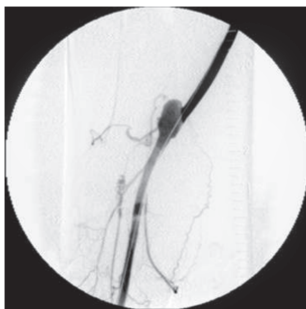
Rycina 2. Angiografia — tętniak rzekomy dystalnego zespolenia prześła udowo-podkolanowego Figure 2. Angiogram — false aneurysm of the distal anastomosis of the femoro-popliteal bypass

For three days before the intervention, the patient had received ticlopidine in a daily dose of 2 × 250 mg, and acetylsalicylic acid — 325 mg daily; 5000 units of