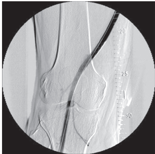
Rycina 4. Angiografia — wyłączone z krążenia tętniak rzekomy dystalnego zespolenia przęśła udowo-podkolanowego przez implantowany stent-graft (Wallgraft)

Większość tętniaków rzekomych po operacjach rekonstrukcyjnych do czasu pęknięcia ma przebieg bezobjawowy. Jest to szczególnie niebezpieczne w przypadku tętniaków zespolenia proksymalnego protezy z aortą lub z tętnicą biodrową. Decydujące znaczenie dla rozpoznania ma ultrasonografia, w mniejszym zaś stopniu — ze względu na koszt oraz konieczność podania środka kontrastowego — arteriografia czy angiotomografia komputerowa. Niemniej w przypadku zmian położonych w przestrzeni zaotrzewnowej lub głęboko w miednicy, szczególnie zaś u chorych otyłych, często pozostają badaniami rozstrzygającymi o rozpoznaniu. Dlatego tak istotna jest rola okresowej kontroli ultrasonograficz-