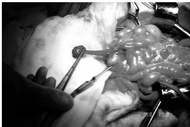
Rycina 3. Zdjęcie śródoperacyjne — widoczny tuż przed polipektomią, wyłoniony z jelita cienkiego, polip na długiej szypule