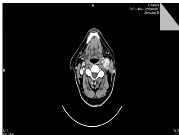
Rycina 2. Obraz TK kłębczak tętnicy szyjnej lewej, stan po radioterapii (ojciec)

The 26-year-old son of the above-mentioned patient was referred to our Department for surgery due to the presence of a tumour in the left common carotid artery site. He had noticed a tumour growing gradually for several months on the left side of the neck with no other coexisting symptoms. The patient had no co-morbidities. There was a palpable, pulsating tumour of size