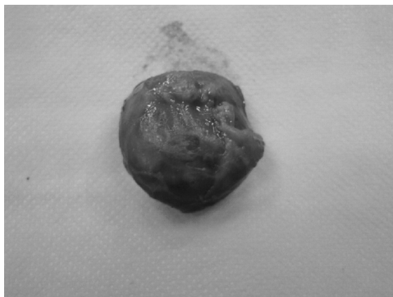
Rycina 7. Kłębczak tętnicy szyjnej lewej (syn). Obraz po wycięciu Figure 7. Carotid artery paraganglioma (son). After excision

vagus, accessory, and sublingual nerves [4, 8]. There are many methods used in the diagnosis of "paraganglioma". The primary examination is an ultrasound scan due to its universality and non-invasive nature. This examination should always include both sides of the neck [9]. In our opinion, ultrasound examination should always be performed with a colour Doppler option, which provides important information about the condition of blood vessels and the blood flow. Other imaging examinations such as CT and MR scanning provide similar information; however, they are much more precise. In our opinion, a CT angiography with 3D reconstruction is a particularly important examination, which provides very detailed information about the morphology and