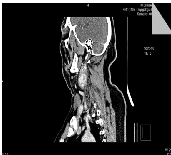
Rycina 3. Obraz TK kłębczak tętnicy szyjnej lewej, stan po radioterapii (ojciec)