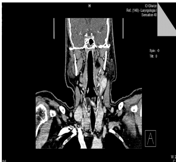
Rycina 4. Obraz TK kłębczak tętnicy szyjnej lewej, stan po radioterapii (ojciec)

Gangliomas grow slowly and locally. During their growth they provoke symptoms caused by compression of the surrounding tissues and organs. The symptoms depend on the location of the tumour. Symptoms of gangliomas located in the jugular vein ampulla and in the tympanic cavity are hearing loss and tinnitus. A rosy, domed and pulsating eardrum is observed in otoscopy. Continued tumour growth leads to paralysis of the facial,