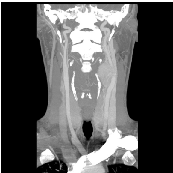
Rycina 5. Obraz TK kłębczak tętnicy szyjnej lewej (syn) Figure 5. CT scan Carotid artery paraganglioma (son)