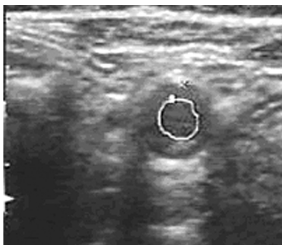
Figure 1. The color Doppler ultrasound study of the common carotid artery. Significant hypoechoic thickening of the artery wall

W olbrzymiokomórkowym zapaleniu tętnic leczeniem z wyboru jest terapia kortykosteroidami. Leki te stosuje się doustnie, jednak w razie zajęcia narządu wzroku przez pierwsze dni zaleca się dożylnie podawanie metyloprednizolonu. Przy niezwłocznym zastosowaniu leczenia zmiany niedokrwienne są potencjalnie odwracalne. Dotychczas jednoznacznie nie określono zarówno początkowej, jak i podtrzymującej dawki leku steroidowego, a także długości leczenia. Na początku prednizon podaje się w dawce 40–80 mg/dobę, co zazwyczaj powoduje znaczącą poprawę kliniczną w ciągu kilku dni. Po miesiącu można próbować zmniejszyć dawkę do 40 mg/dobę (zmniejszenie o 5 mg w ciągu każdego tygodnia), wreszcie do 20 mg. Przy dalszym zmniejszeniu dawki należy kontrolować objawy kliniczne, wartości OB i stężenie CRP. Steroidoterapię najczęściej trzeba stosować przez wiele lat [8].