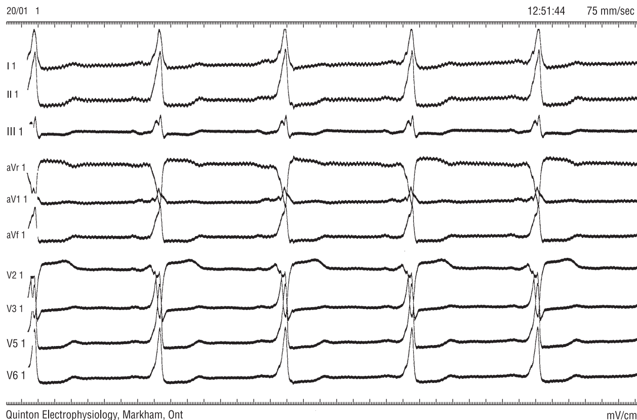
Rycina 6. Zapis spoczynkowy EKG pacjenta z drogą dodatkową o lokalizacji przednioprzegrodowej