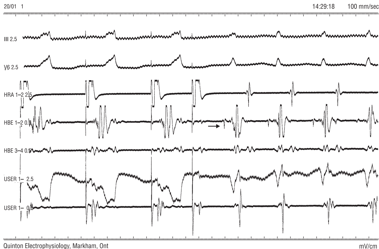
Rycina 4. Stymulacja programowana przedsionka z czasem sprzężenia bodźca dodatkowego krótszym od refrakcji drogi dodatkowej w kierunku zstępującym. Bodziec dodatkowy przewodzi się do komór łącem fizjologicznym, bez cech preekscytacji. Widoczny potencjał pęczka Hisa (strzałka) w zapisie z elektrody rejestrującej hisogram i brak potencjału Hisa w zapisie z elektrody ablacyjnej świadczy o bezpiecznym jej ułożeniu. Stymulacja zapoczątkowuje częstoskurcz. Oznaczenia jak na rycinie 2

Figure 4. Programmed stimulation of the right atrium with the coupling time of extrastimulus shorter than refractory period of accessory pathway. Extrastimulus conducts to ventricle through physiologic junction, without signs of preexcitation. His-potential can be seen in tracing from electrode in His-area (arrow), but can not be seen in tracing from ablation catheter, what confirms safe location of the latter. Stimulation initiates tachycardia. Explanations — like on the figure 2