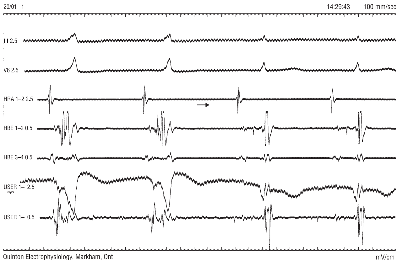
Rycina 5. Zapis wewnątrzsercowy w trakcie aplikacji prądu RF. Po dwóch pobudzeniach przewodzonych z preekscytacją, widoczne ustąpienie cech preekscytacji — skuteczna aplikacja (strzałka). Oznaczenia jak na rycinie 2

Figure 5. Intracardiac tracing during RF-application. After second beat, which conducts with preexcitation, signs of preexcitation disappear (arrow) — successful application. Explanations — like on the figure 2