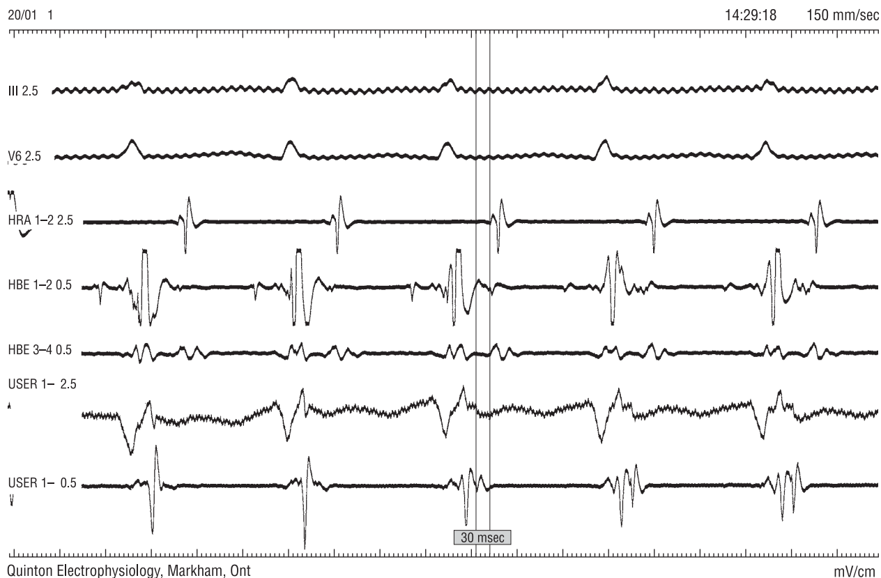
Rycina 3. Zapis wewnątrzsercowy zarejestrowany w trakcie ortodromowego częstoskurczu przedsionkowo-komorowego u chorego z przednioprzegrodową drogą dodatkową. Zapis z elektrody ablacyjnej w miejscu skutecznej aplikacji — wsteczny potencjał przedsionka (A) rejestrowany przez elektrodę ablacyjną (pierwszy znacznik) wyprzedza o 30 ms wsteczny potencjał A rejestrowany przez elektrodę w okolicy pęczka Hisa (drugi znacznik). Oznaczenia jak na rycinie 2

Figure 3. Intracardiac electrogram recorded in patient with antero-septal accessory pathway during orthodromic atrio-ventricular reentry tachycardia. Signals obtained from ablation catheter placed at the point of successful RF application — retrograde atrial (A) potential as recorded by ablation electrode (first calipers) precedes A-potential recorded by electrode in His-area (second calipers) by 30 ms. Explanations — like on the figure 2