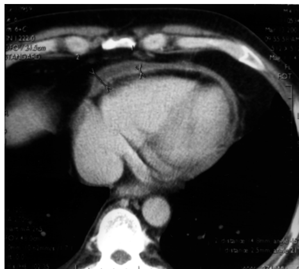
Rycina 4. Tomografia komputerowa. Zwapnienia blaszki ściennej osierdzia